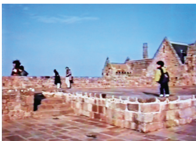
図6. 屋上広場 子供たちはいつとき遊び場として過ごせた模様、右向うに見える建物の内部がロマネスク風の廻廊と芝生グリーン広場を構成している。

坂道を登って行き、ほぼ最上階部と思しきスペースに図6の様な広場風の一角があり、子供達などはいつとき、遊び場として確保できた気分で、修道院を楽しんでいる様でした。