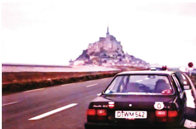
図4. モン・サン・ミッシェル修道院への導入路に一時停車、ここから少し先に駐車スペースがある。

レストランにはいろいろと気軽なランチメニューがある様で、皆それぞれの料理を楽しみながら、坂の途中のレストラン、その窓から見晴らす大西洋、大海原の風情を楽しんでいる様でありました。