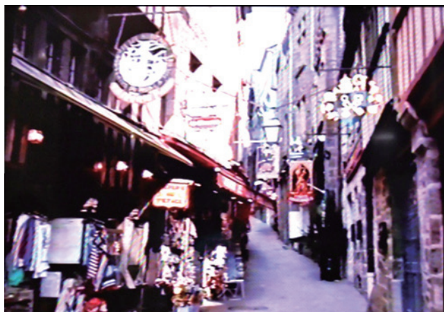
図5. 最上階へ向かう坂道の両側には土産物店、レストランが軒を連ねている。

レストランにはいろいろと気軽なランチメニューがある様で、皆それぞれの料理を楽しみながら、坂の途中のレストラン、その窓から見晴らす大西洋、大海原の風情を楽しんでいる様でありました。