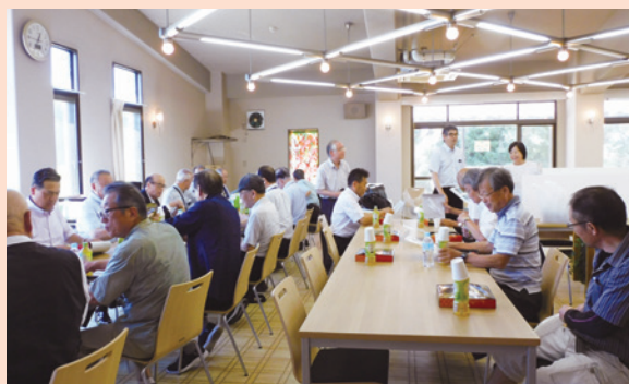
名誉教授の先生方との食事会