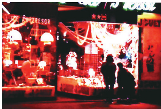
図11. 宿のあるポントルソンに着き、ウインドウショッピングする家族

静かな町にその宿 HOTEL DE LA POSTE を探し当て、そのあと、町を歩きながら夕食を求めた小さなレストランで一息つきました。今日の走行はシェルブールの町から220km程度でしたね。(続く)