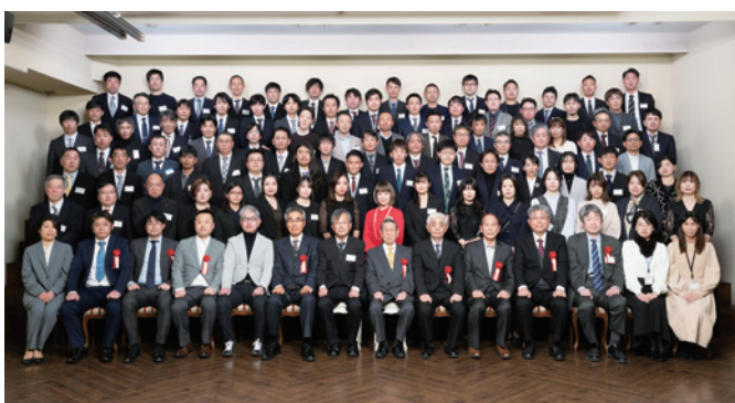
阿南高専第9回拓土会 令和7年1月4日 於JRHホテルクレメント徳島