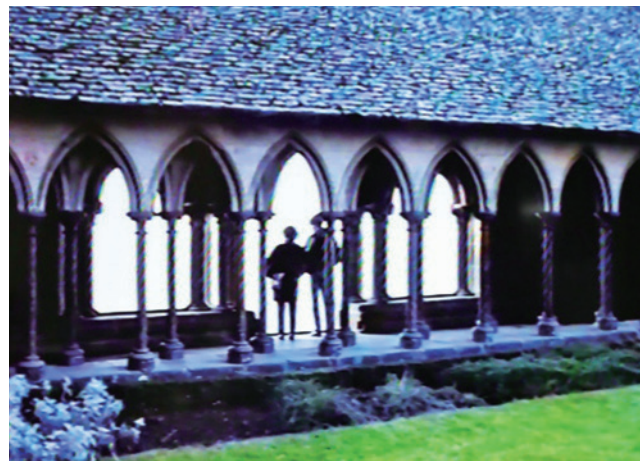
図7. ロマネスク風の廻廊とその芝生絨毯で構成された廻廊と中庭

又、修道院の内部には図8の様な騎士の像などが建てられており、八世紀に創建された修道院の歴史の深さを思い起こされる内容でありました。