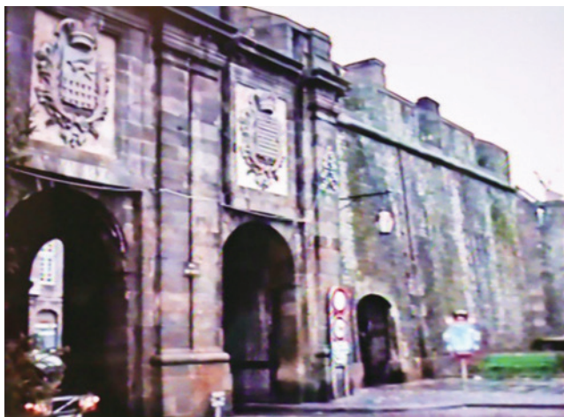
図9. サン・マロの城壁