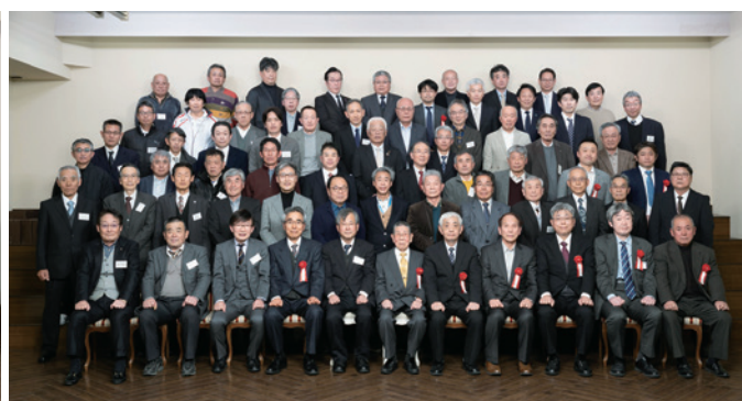
阿南高専第9回拓土会 令和7年1月4日 於JRHホテルクレメント徳島