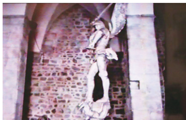
図8. 院内の騎士の像

修道院内部を一通り目に納めた後、この現代の修道院の様子を心に刻みつ、あの坂道を下り、海に面して西隣り“城塞の都市サン・マロ”へと駒を進めました。