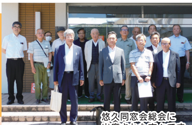
悠久同窓会総会に出席された方々です。